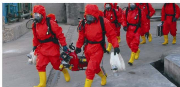
15 HUANGYAN QINGQIXIE