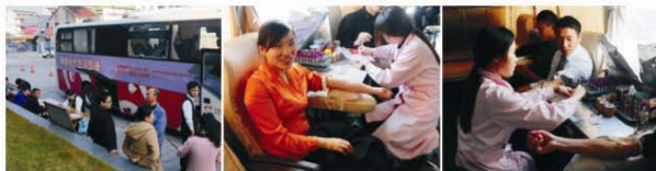
14 HUANGYAN QINGQIXIE

用自己的点滴为他人开一朵花, 添一份生存下去的机会, 用我们的心为他人作伴, 为他人染一片色彩, 就是给我们自己的人生喝彩。